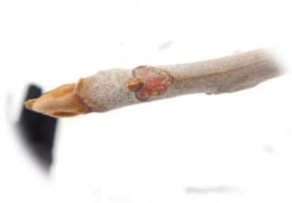
ヤマウルシ（ウルシ科）